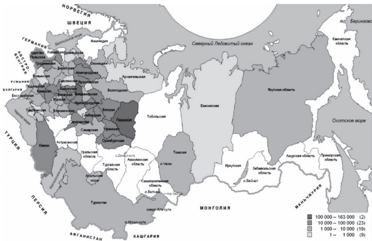
Рис. 1. Субсидирование кустарно-промышленных мероприятий ГУЗиЗ по губерниям и областям Российской империи за 3 года (1909–1911 гг.), руб.

Таким образом, на примере финансирования реализации кустарно-промышленной политики земледельческим ведомством можно предположить, что методика выравнивания при распределении межбюджетных трансфертов в Российской империи не действовала. Работала обратная система: чем больше регион тратил средств на определенные мероприятия, тем больше получал от центрального аппарата. Следовательно, основным фактором, влияющим на объемы правительственного кустарно-промышленного финансирования, являлись объемы региональных вложений в кустарно-промышленную политику. Использование ГИС позволяет установить, что преобладающая часть финансовой помощи шла на восточноевропейские земские губернии и на Урал. Можно предположить, что такая политика проводилась с целью поднятия кустарной промышленности как отрасли производства до уровня основной в отдельном регионе, где другие отрасли, сельское хозяйство, фабрично-заводская промышленность на данном этапе находилась в упадке, и в конечном итоге правительство стремилось поднять благосостояние