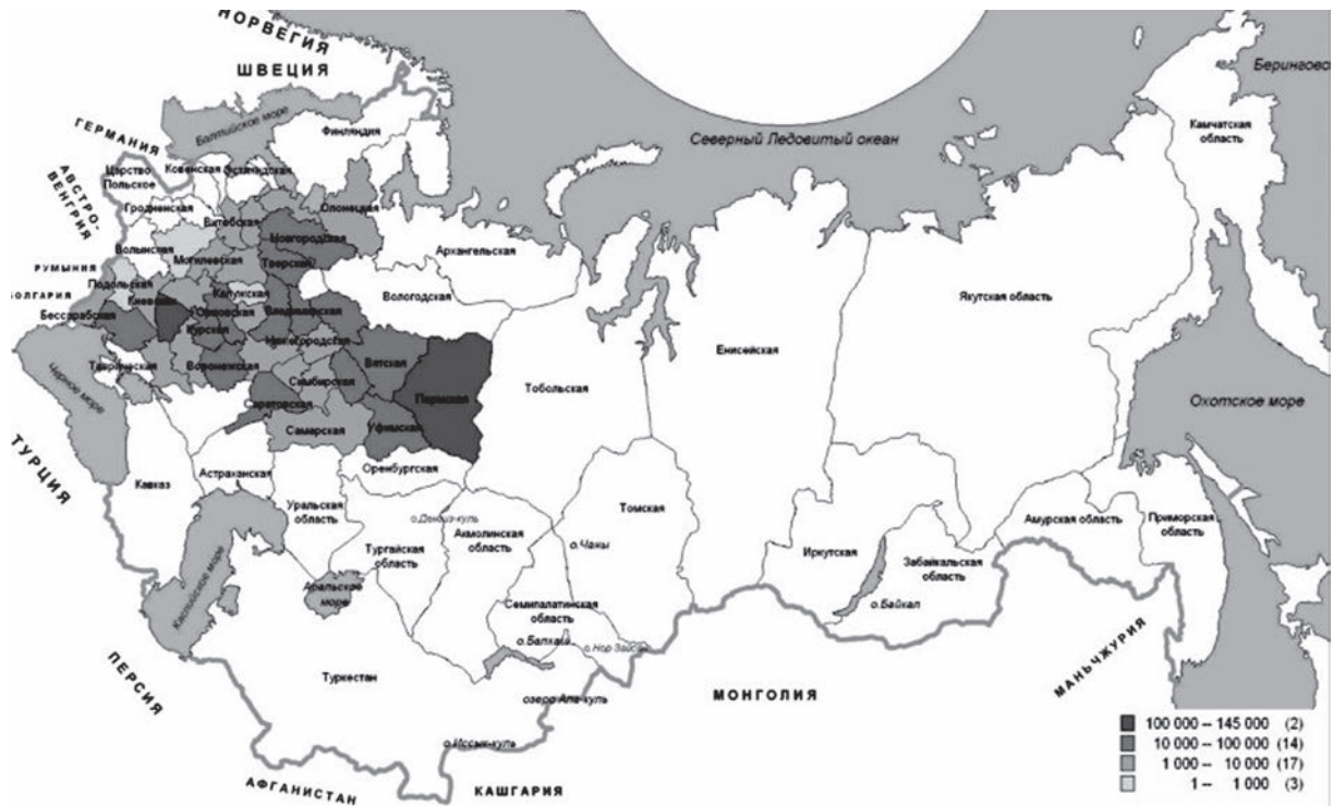
Рис. 2. Субсидирование кустарно-промышленных мероприятий ГУЗиЗ по губерниям и областям Российской империи за 3 года (1911–1913 гг.), руб.

риях кустарного производства, но 1920-е гг. показали, насколько сильны были в России кустарные промыслы и, следовательно, политика по их развитию оставалась довольно перспективной и в последующие годы.